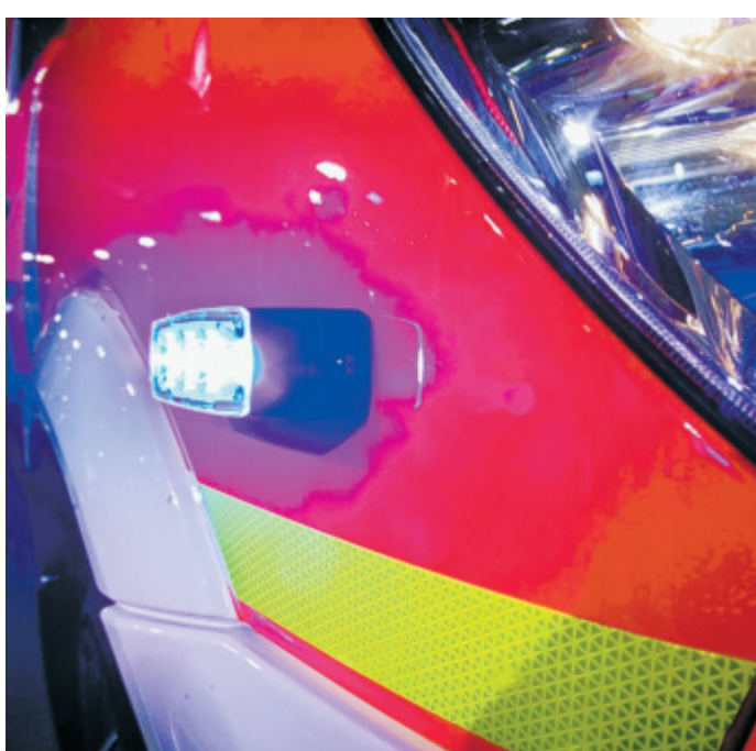
Vorreiter: Dieses blaue LED-Blitzlicht am Kotflügel ist erst das dritte in Deutschland. Es soll Autofahrer von der Seite früher warnen.