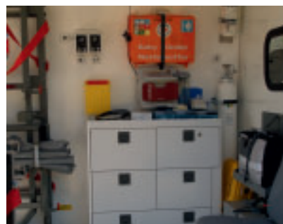
Der Patientenraum bietet viel Stauraum für die Medizintechnik, z. B. mit speziellen Halterungen für den Notfallkoffer.