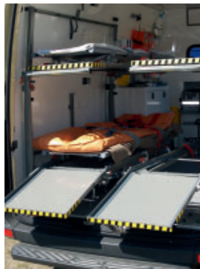
Vier-Tragen-System: Im Katastrophenfall können bis zu vier Patienten liegend transportiert werden.