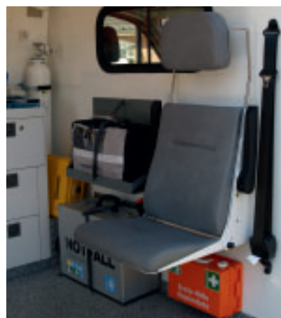
Durchdachte Ergonomie: Sämtliche Bedienelemente und die Medizintechnik lassen sich gut vom Arztsitz aus erreichen.